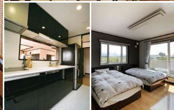
キッチン。冬の朝の家事も寒くない。