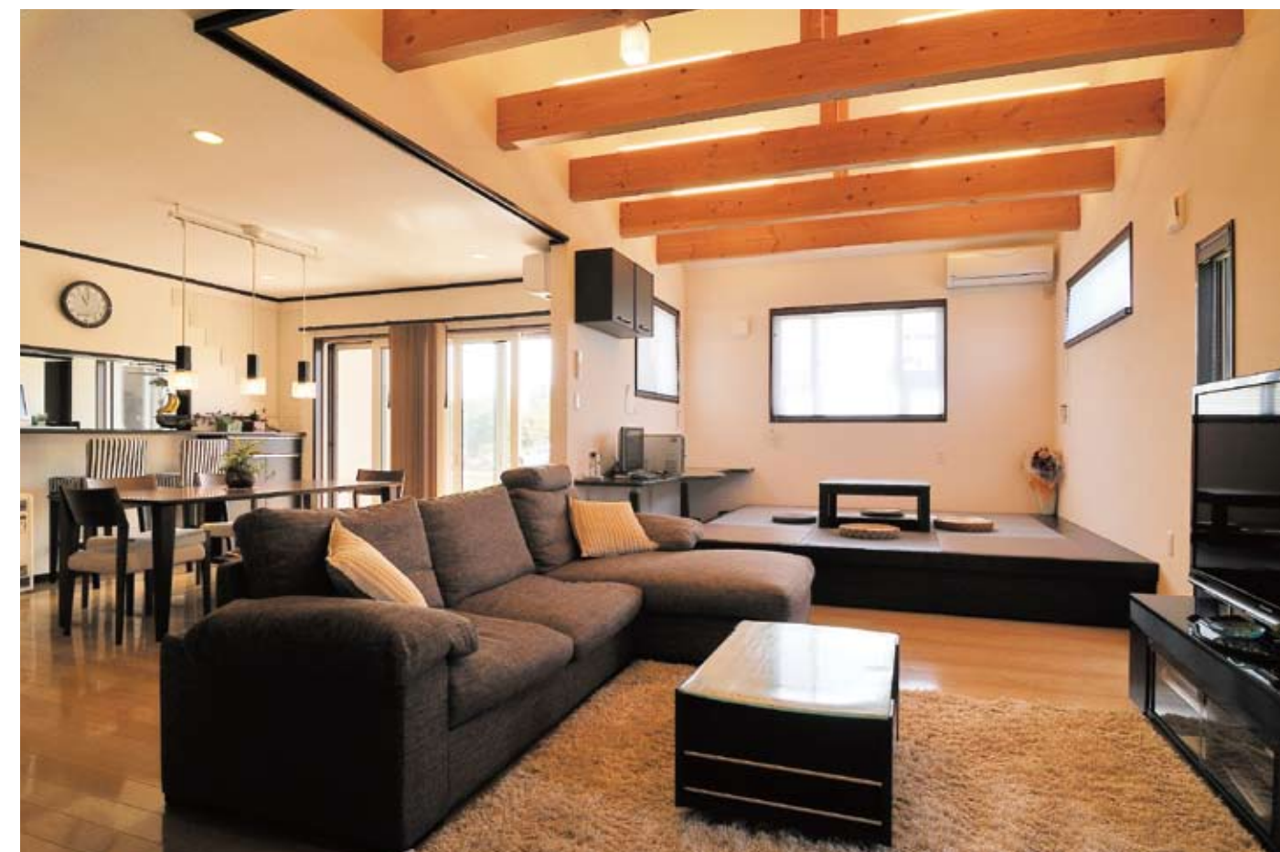
広く、一部吹き抜けにもなっている邸のリビングダイニング。これだけの大きな空間でも、エアコンはあっとい間にも効くのだとか。