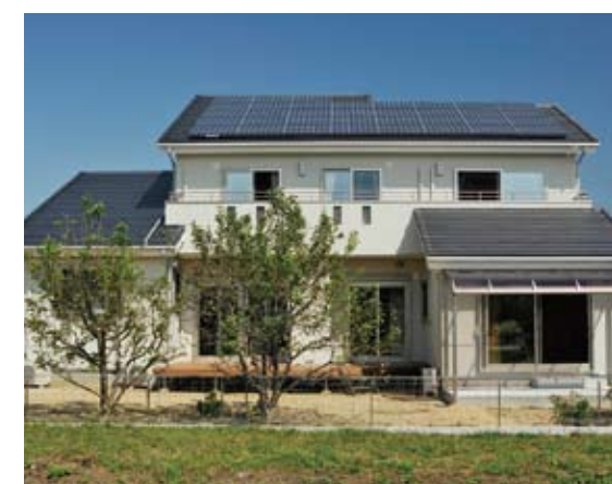
邸外観。FPの家に、ソーラー発電を導入し、光熱費ゼロを目指している。

現在世間では「エコ」「省エネ」が注目されている。そんな中、長年の実績と信頼を積み重ねてきている「米杉建設」は、40年以上も前から地域とともに歩んできた歴史があり、10年以上も前から省エネ住宅に取り組み大きな成果を残してきた。同社の場合、「何が一番お客様のためになるのか」ということが地域に貢献することになるのか「を追求し続けるなかで、必然的にたどり着いたのが、「エコ」「高気密・高断熱」といった現在では当たり前になっているこれらの住まいに関する機能性能。モノありきで売っているのではなく、「米杉建設」は「家を構築し、家を通じて「人の笑顔」を創造・提供しようとしているのだ。