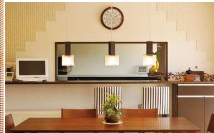
ダイニングからキッチン方向を望む。