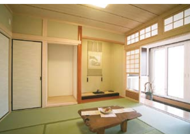
写真上) 玄関脇の土間。ここでご近所さんとのコミュニケーションが生まれるのだろう。写真下) リビングとは対照的な雰囲気な和室。やはり心和むもの。